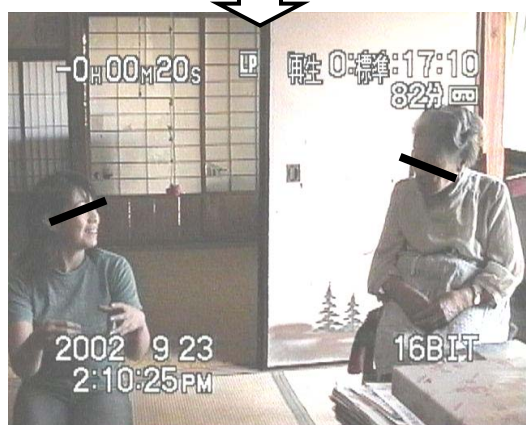
【画像データ 2 : Z の体勢変化】