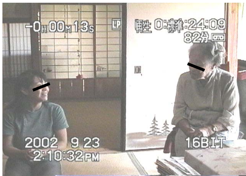
【画像データ1：カメラ撮影範囲（図1での点線部分）】